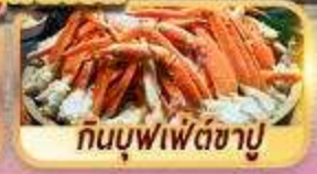
กินบุฟเฟ่ต์ซาปู