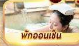
พักออนเซ็น