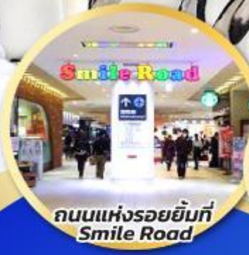
ถนนแห่งรอยยิ้มที่ Smile Road