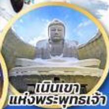
เบ็นเนกา แห่งพระพุทธรเจ้า

ชมความน่ารักของสัตว์ต่างๆ ที่พิพิธภัณฑ์สัตว์น้ำโอตารุ