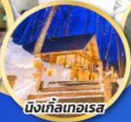
นิงเกิ้ลเทอเรส