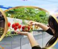
บุฟเฟ่ต์ สดอเบอริ

เดินทาง 17 - 22 มกราคม 68 24 - 29 มกราคม 68 31 มกราคม - 05 กุมภาพันธ์ 68