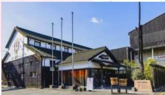
MARUKIN SOY SAUCE MUSEUM

หนึ่งในไฮไลท์ที่พลาดไม่ได้เมื่อมาเยือนพิพิธภัณฑ์แห่งนี้ คือ "โถงศรีมซอพต์เสิร์ฟซอสถั่วเหลือง" รสชาติที่ผสมผสานความหอมหวานของโถงศรีมกับความเค็มกลมกล่อมของซอสถั่วเหลืองได้อย่างลงตัว เป็นรสชาติที่แปลกใหม่และน่าสนใจ (บริการฟรี ท่านละ 1 โถง)