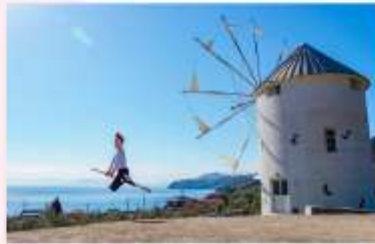
SHIDOSHIMA OLIVE PARK