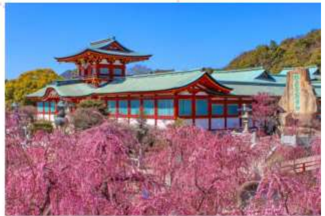
HOFU TENMANGU SHRINE