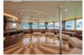
รับประทานอาหารกลางวัน ณ กิคุคาคุวาระ