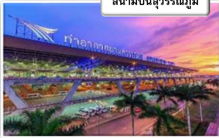
สนามบิสสุวรรณภูมิ

เวลา 19.00 น. พร้อมกันที่ สนามบิสสุวรรณภูมิ อาคารผู้โดยสารขาออกระหว่างประเทศเคาน์เตอร์ สายการบินไทยแอร์เวย์เจ้าหน้าที่คอยให้การต้อนรับ ดูแลด้านเอกสาร เช็คอิน และสัมภาระในการเดินทาง