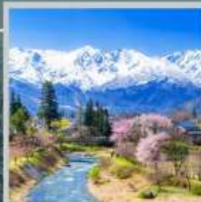
"HAKUBA OIDE PARK"