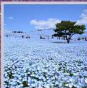
"HITACHI SEASIDE PARK"