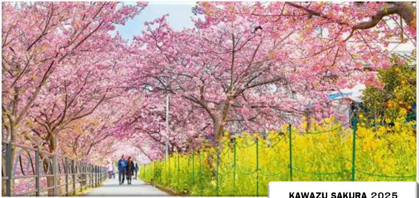
KAWAZU SAKURA 2025

คาวาซุ ซากุระ เฟสติวัล (Kawazu Sakura Festival) โดยมักจัดช่วงต้นเดือนกุมภาพันธ์ – ต้นเดือนมีนาคม ของทุกปี ซึ่งได้รับความสนใจอย่างมาก มีผู้เข้าชมมากถึง 1 ล้านคน จุดเด่นของดอกซากุระของที่นี่คือดอกมีสีชมพู และมีขนาดใหญ่พิเศษ ที่นี่มีซากุระมากถึง 8,000 ต้น