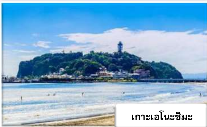
เกาะเอโนะชิมะ

ปราสาทโอดาวาระ - ล่องเรือทะเลสาบอาชิ - ออนเซน