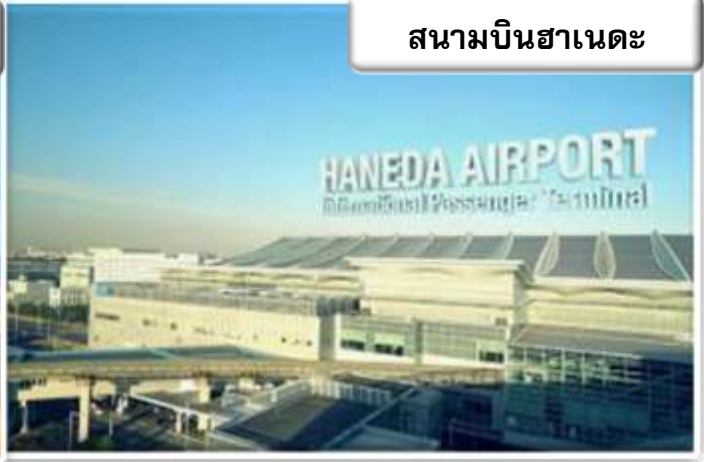
สนามบินฮาเนดะ

เวลา 20.30 น. พร้อมกันที่ ท่าอากาศยานสุวรรณภูมิ อาคารผู้โดยสารขาออกระหว่างประเทศ เคาน์เตอร์ สายการบินไทย เจ้าหน้าที่คอยให้การต้อนรับ ดูแล ด้านเอกสาร เช็คอิน และสัมภาระในการเดินทาง