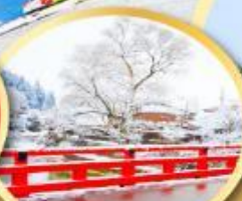
สะพานนากะบาชิ