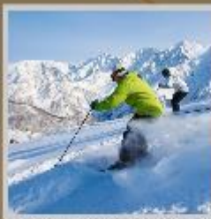
"HAKUBA SKI RESORT"