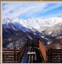
"HAKUBA MOUNTAIN HARBOR"

**ราคาทัวร์ดังกล่าวรวมค่าธรรมเนียมที่พักแล้ว