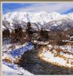
"HAKUBA OIDE PARK"