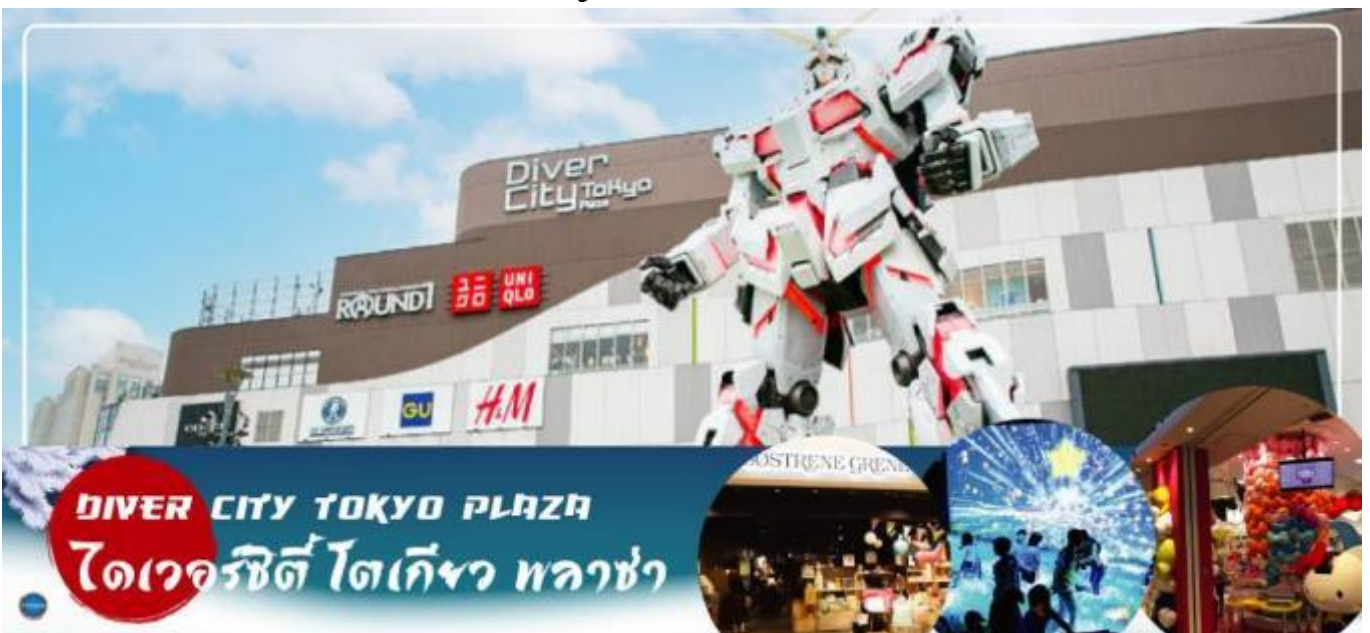
DIVER CITY TOKYO PLAZA ไดเวอร์ซิตี โตเกียว พลาซ่า

จากนั้นเดินทางสู่ ย่านโอไดบะ (Odaiba) (ใช้เวลาเดินทางประมาณ 30 นาที) คือเกาะที่สร้างขึ้นไว้เป็นแหล่งช้อปปิ้ง และแหล่งบันเทิงต่างๆ ในอ่าวโตเกียว ได้รับการปรับปรุงให้มีชื่อเสียงและเป็นที่ยอมรับในช่วงหลังของปี 1990 นอกจากนี้มีสถาปัตยกรรมที่สวยงามตั้งอยู่มากมายแล้ว แต่ก็ยังคงความเป็นธรรมชาติไว้ด้วยความอุดมสมบูรณ์ของพื้นที่สีเขียว ไดเวอร์ซิตี โตเกียว พลาซ่า (Diver City Tokyo Plaza) เป็นห้างดังอีกห้างหนึ่ง ที่อยู่บนเกาะ โอไดบะ จุดเด่นของห้างนี้ก็คือ หุ่นยนต์กันดั้มขนาดเท่าของจริง ซึ่งมีขนาดใหญ่มาก ในบริเวณห้าง อิสระช้อปปิ้งตามอัธยาศัย