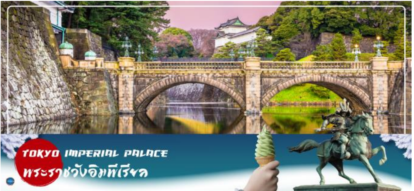
TOKYO IMPERIAL PALACE พระราชวังอิมพีเรียล

นำท่านเดินทางสู่ พระราชวังอิมพีเรียล (Imperial Palace) (ชมและถ่ายภาพด้านนอก) (ใช้เวลาเดินทางโดยประมาณ 30 นาที) เป็นที่ประทับของสมเด็จพระจักรพรรดิแห่งญี่ปุ่น ภายในพื้นที่กว้างใหญ่ประกอบด้วยพระตำหนักและอาคารต่างๆมากมาย ชม สะพานนิจูบashi (Nijubashi Bridge) หรือสะพานแวนดา เส้นโค้งของสะพานข้ามคูน้ำสู่พระราชวังแห่งกรุงโตเกียว ที่มีชื่อเรียกว่า แวนดาก็เพราะส่วนโค้งที่อยู่ติดกันด้านล่างสะพานนั้นมีรูปร่างเหมือนแวนดาเมื่อสะท้อนกับผิวน้ำ ส่วนทางด้านหน้าพระราชวังเป็นอุทยานแห่งชาติโคเคียวไกเอิน (Kokyo Gaien National Garden) เป็นสวนสาธารณะขนาดใหญ่