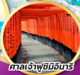
ศาลเจ้าฟูชิมิอินาริ