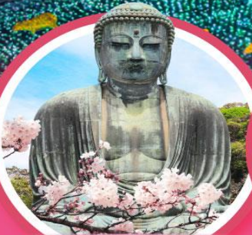
หลวงพ่อดโตบุตสึ