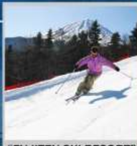
"FUJITEN SKI RESORT"