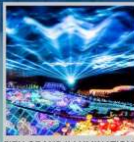
"IZU GRAND ILLUMINATION"