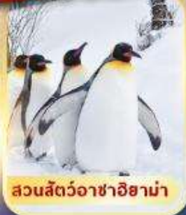
สวนสัตว์อาซาฮิยาม่า