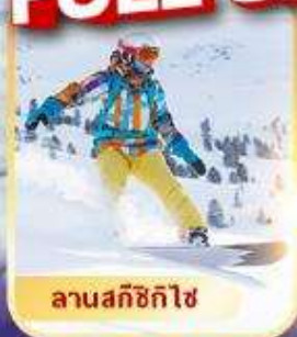
ลานสกีซิกิไซ