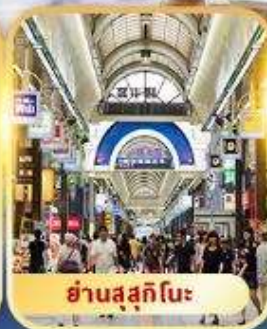
ย่านสุซุกิโนะ