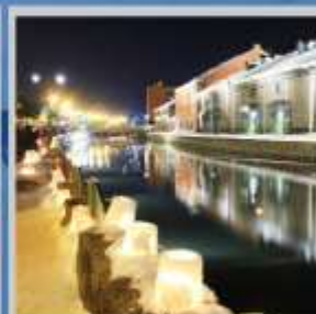
"OTARU CANAL FEST"