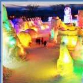
"SHIKOTSU ICE FEST"