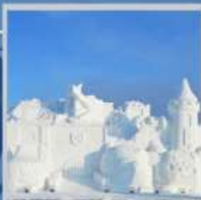
"ASAHIKAWA SNOW FEST"