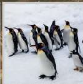
"PENGUIN ASAHİYAMA ZOO"