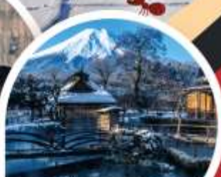
หมู่บ้านโอฮิโนะฮักโก