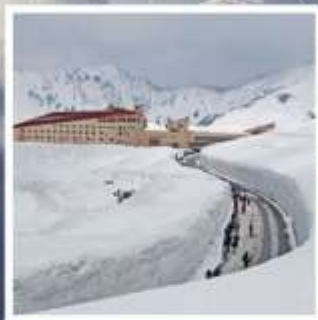
กำแพงหิมะ เจแปนแอลป์