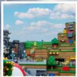
ยูนิเวอร์ซัล สตูดิโอส์ เจแปน