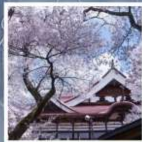
สวนสาธารณะซากุระปราสาทคาเคียว