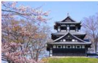
TAKADA CASTLE SITE PARK