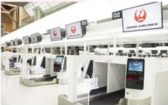
NARITA INTERNATIONAL AIRPORT

“สนามบินนานาชาตินาริตะ” เป็นสถานที่ที่นักท่องเที่ยวส่วนใหญ่จะได้สัมผัสเป็นที่แรกหลังจากมาถึงญี่ปุ่น ที่มีเป็นสนามบินที่ทันสมัย สะดวกสบาย และได้รับการออกแบบมาเป็นอย่างดี อาคารผู้โดยสารหลักสองแห่งมีทั้งร้านค้า ร้านอาหาร พื้นที่นั่งรอสุดผ่อนคลาย หอชมทิวทัศน์ และกิจกรรมต่างๆ ที่จะทำให้คุณเพลิดเพลินอยู่ตลอด