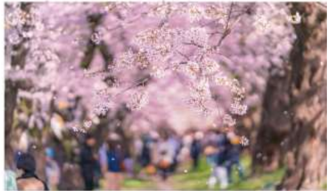
KUMAGAYA SAKURA TSUTSUMI