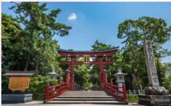
KEHI JINGU SHRINE

“ศาลเจ้าเคอิ จิงกุ” เป็นหนึ่งในศาลเจ้าเก่าแก่ และสำคัญที่สุดแห่งหนึ่งในญี่ปุ่น มีอายุกว่า 1,300 ปี จุดเด่นที่โดดเด่นที่สุด คือโทริอิไม้ขนาดใหญ่สูงประมาณ 11 เมตร ซึ่งเป็นหนึ่งในสามของโทริอิไม้ที่ใหญ่ที่สุดในญี่ปุ่น และได้รับการขึ้นทะเบียนเป็นสมบัติทางวัฒนธรรมที่สำคัญ ผู้คนมักจะมาขอพรในเรื่องต่างๆ เช่น สุขภาพ ความรัก การงาน และความสำเร็จ