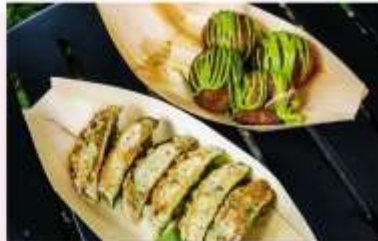
UJI MATCHA STREET