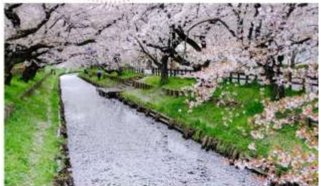
SHINGASHI RIVERBANK CHERRY BLOSSOMS

“ชมความงดงามของซากุระ-ริมแม่น้ำชินกาชิ” ในเมืองคาวาโกเอะ จังหวัดไซตามะ: เป็นอีกหนึ่งสถานที่ที่ได้รับความนิยมอย่างมากในช่วงฤดูใบไม้ผลิ ด้วยความงดงามของดอกซากุระที่เบ่งบานสะพรั่งสองข้างทางริมแม่น้ำยาวกว่า 500 เมตร ภาพของดอกซากุระ-สีชมพูอ่อนโยนที่สะท้อนลงบนผิวน้ำ สร้างบรรยากาศที่โรแมนติกและงดงามราวกับภาพวาด