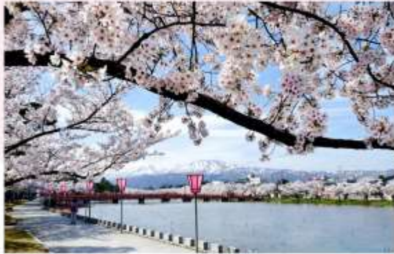
TAKADA CASTLE SITE PARK