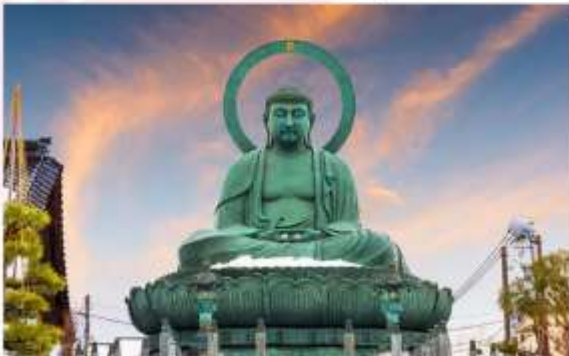
TAKAOKA GREAT BUDDHA

ขอพร “พระใหญ่ทาคาโอกะ หรือ ทาคาโอกะโคบุตสึ” เป็นหนึ่งในพระพุทธรูปทองสัมฤทธิ์ที่ใหญ่และสวยงามที่สุดในญี่ปุ่น ตั้งอยู่ในเมืองทาคาโอกะ พระพุทธรูปองค์นี้มีความสูงถึง 16 เมตร สร้างจากทองสัมฤทธิ์ที่ผลิตในท้องถิ่น และใช้เวลาสร้างนานถึง 26 ปี