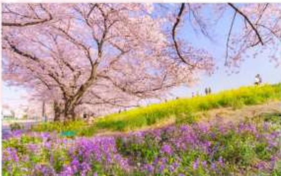
KUMAGAYA SAKURA TSUTSUMI