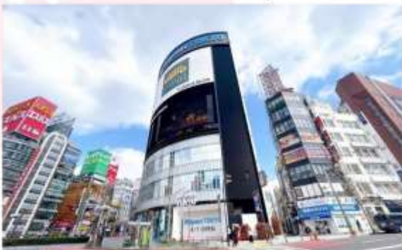
SHOPPING AT SHINJUKU

เพลิดเพลินกับการช้อปปิ้ง และสัมผัสบรรยากาศอันคึกคัก กันสมัยของ “ย่านชินจูกุ” แหล่งช้อปปิ้งสุดคูลิ่งการ ที่รอให้เหล่านักช้อปปิ้งทั้งหลาย มาตะลุย! ไม่ว่าจะคุณจะมาหาแฟชั่นล่าสุด เครื่องใช้ไฟฟ้าสุดไฮเทค หรือของฝากสุดพิเศษ ชินจูกุมีครบทุกอย่างให้คุณได้ช้อปปิ้งเพลิน