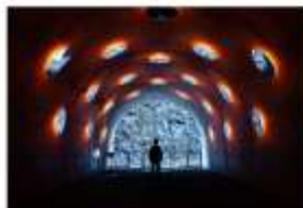
รับประทานอาหารค่ำ ภายในโรงแรม