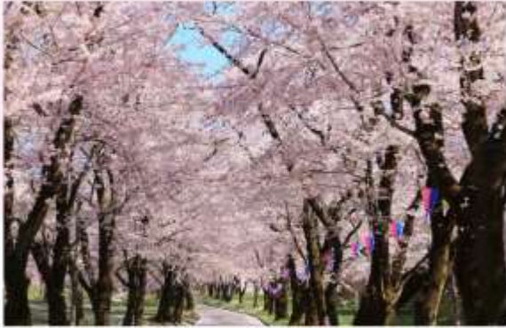
AKAGI NANMEN SENBONZAKURA

"เทศกาลอะคากิ นันเมน เซบบงซากุระ" เป็นเทศกาลชมดอกซากุระที่ยิ่งใหญ่ และเป็นที่ยูจิกันดึในประเทศญี่ปุ่น หนึ่งในไฮไลท์ที่สำคัญคืออุโมงค์ซากุระที่ทอดยาวกว่า 1.3 กิโลเมตร เมื่อดอกซากุระบานเต็มที่ จะรู้สึกเหมือนเดินอยู่ในโลกแห่งความฝันที่รายล้อมไปด้วยกลิ่นดอกสีชมพู นอกจากนี้ ดอกซากุระแล้ว ยังมีทุ่งดอกบานโนะฮานะสีเหลืองอร่ามที่เบ่งบานอยู่ใกล้เคียง ทำให้เกิดภาพตัดกันของสีชมพูและสีเหลืองที่สวยงาม