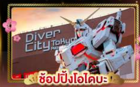
ช้อปปิ้งไอโดบะ