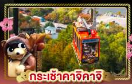
กระเช้าคาจิคาจิ