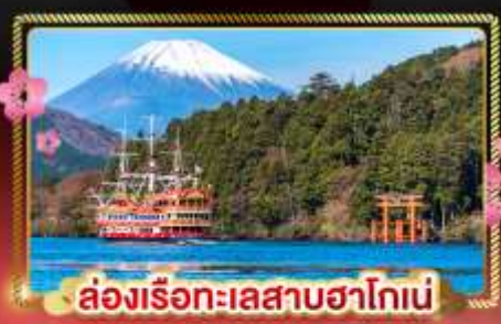
ล่องเรือทะเลสาบฮาโกเน่