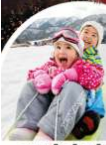
ลานสกี-โตะโก-โนะซาโตะ