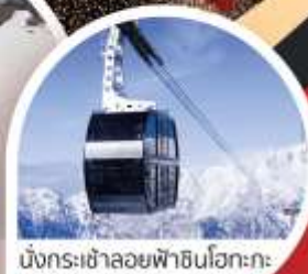
นั่งกระเช้าลอยฟ้าขึ้นโตะโกะ

Wifi on bus บริการน้ำดื่ม 10 คน ออกเดินทาง