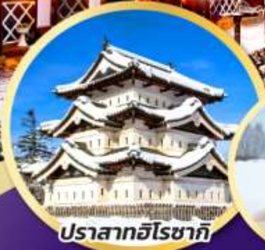
ปราสาทอิโรซากิ