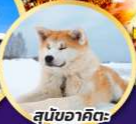
สุนัขอาคิตะ