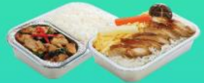
บริการอาหารร้อนบนเครื่องบิน ขาไป - ขากลับ