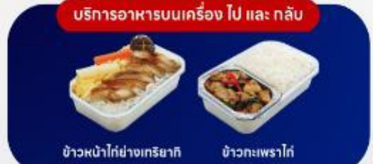
บริการอาหารบนเครื่อง ไป และ กลับ