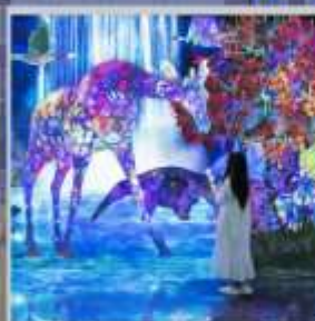
"TEAM LAB FOREST"