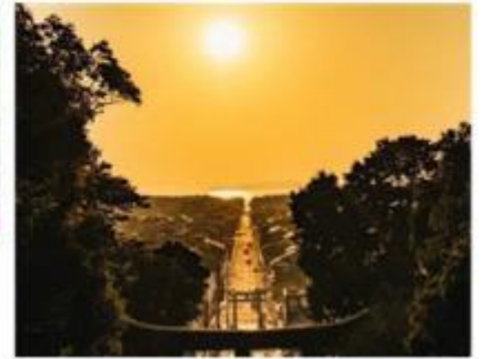
ศาลเจ้ามียาจิดาเกะ Miyajidake Shrine

จากนั้นนำท่านเดินทางกลับสู่ เมืองฟูกุโอกะ เมืองใหญ่อันดับ 6 ของญี่ปุ่น และเป็นเมืองที่ได้รับการจัดอันดับว่าเป็นเมืองน่าอยู่อันดับที่ 12 ของโลก