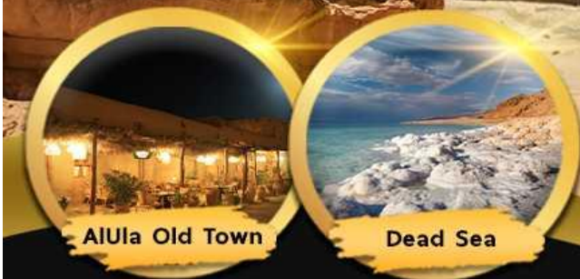
AlUla Old Town