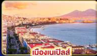
เมืองเนเปิลส์