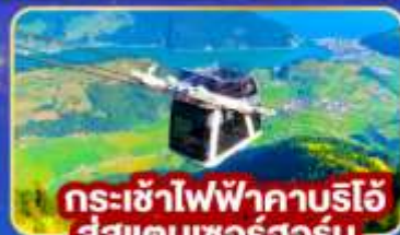
กระเช้าไฟฟ้าคาบรีโอ สู่สแตนเซอร์ฮอร์น

พิเศษ! พิเศษยอดเขาติอาโวลีซซา พร้อมเมนูกะเพราไทย