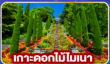
เกาะดอกไม้มอเนาะ