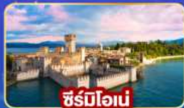
ซีร์บิโอเน่

89,900.- ราคาเริ่มต้น 📅 เดินทาง : 08-15เม.ย 68