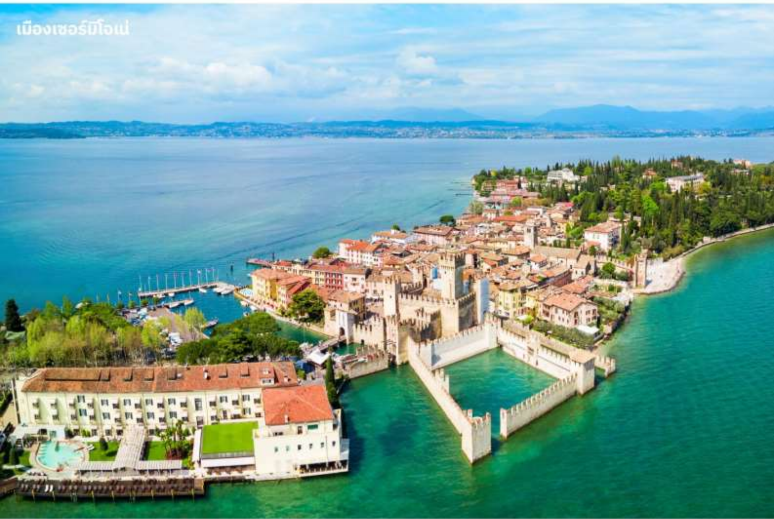
เมืองเซอร์มิโอเน่

บริการอาหารค่ำ ณ ภัตตาคาร นำท่านเข้าสู่ที่พัก IH Hotels Milano Lorenteggio หรือเทียบเท่า