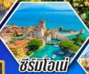
ซีร์มิโอนี