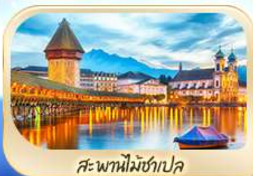
สะพานไมซ์าป