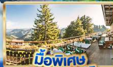
มือพิเศษ บียอดเวริท