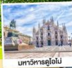
มหาวิหารคูโอโม

09-15 พ.ย. 67 28 ม.ค.-03 ก.พ. 68 12-18 มี.ค. / 11-17 เม.ย. 68 07-13 พ.ค. 68