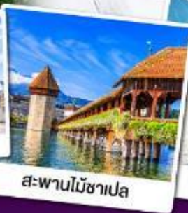
สะพานไม้ซาเปล