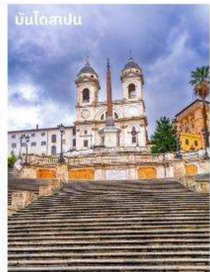
บันไดสเปน