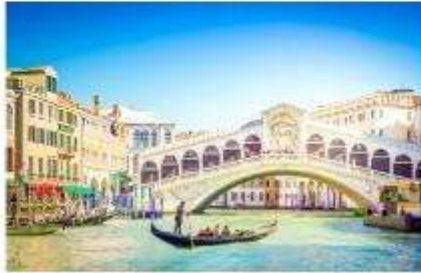
สะพานริอัลโต