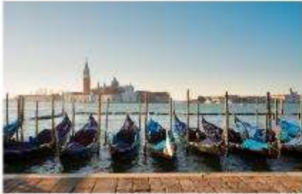
เรือกอนโดล่า

นำท่านออกเดินทางสู่ ท่าเรือตรอนเกตโต เพื่อเตรียมตัวนั่งเรือข้ามสู่เกาะเวนิส เกาะเวนิสเป็นดินแดนแสนโรแมนติก เป็นเมืองที่ไม่เหมือนใคร โดยใช้เรือแทนรถ ใช้คลองแทนถนน มีสมญานามว่าเป็น “ราชินีแห่งทะเลเอเดรียติก” มีเกาะน้อยใหญ่กว่า 118 เกาะและมีสะพานเชื่อมถึงกัน กว่า 400 แห่ง