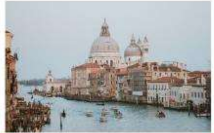
แกรนด์คาแนล

นำทุกท่านนั่งเรือต่อเพื่อไปยัง ท่าเรือซานมาร์โก (San Marco Pier) บนเกาะเวนิส แวะให้ท่านถ่ายรูปสวยๆ เก็บเป็นที่ระลึกกันที่ พระราชวังดอดจ์ พระราชวังริมน้ำแสนอลังการ ที่สร้างตั้งแต่ศตวรรษที่ 14 ในสไตล์เวเนเซียนโกธิค ที่เคยเป็นที่ประทับของผู้ปกครองของเวนิส แต่ตั้งแต่ปี 1923 ก็ได้เปลี่ยนเป็นพิพิธภัณฑ์ให้คนทั่วไปได้เข้าชม เป็นหนึ่งในแลนด์มาร์คหลักของเวนิส จากนั้นเดินเที่ยวชมแลนด์มาร์คสำคัญต่างๆ ในเมือง จัตุรัสเซนต์มาร์ค เป็นจัตุรัสหลักของเมืองเวนิส และยังเป็นศูนย์กลางเมืองตั้งแต่โบราณ จากนั้นนำท่านถ่ายรูปกับ มหาวิหารเซนต์มาร์ค มหาวิหารใหญ่ ของศาสนาคริสต์นิกายโรมันคาทอลิก อลังการด้วยการตกแต่งด้วยโดมใหญ่ และที่อยู่ติดกันและโดดเด่นด้วยความสูงถึง 50 เมตรก็คือ หอรบั้ง ถือเป็นหนึ่งในสัญลักษณ์ของเมืองที่ เห็นได้ไม่ว่าจะอยู่มุมไหนของเมืองก็ตาม และที่พลาดไม่ได้เลยก็คือ สะพานกอนหายใจ สะพานอันโด่งดังแห่งนี้ตั้งอยู่เหนือแม่น้ำที่คั่นกลางระหว่างคุกเก่ากับพระราชวังดอดจ์