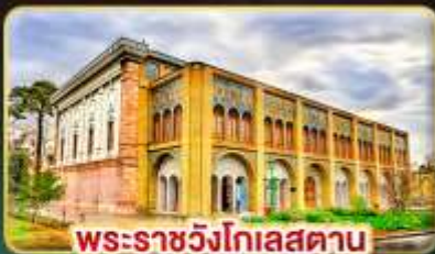
พระราชวังโกเลสถาน

เยือนอารยธรรมเปอร์เซีย เก็บครบทุกไฮไลต์สำคัญ