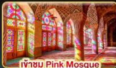
เข้าชม Pink Mosque