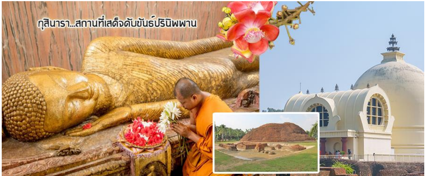
กุสินารา...สถานที่เสด็จดับขันธปรินิพพาน

นำท่านเดินทางสู่ สังเวชนียสถานแห่งที่ 2 นมัสการสถานที่ปรีนิพพาน ณ สาละวิน อุทยาน สถานที่เสด็จดับขันธปรินิพพาน มีต้นสาละปลูกไว้เป็นอนุสรณ์ นมัสการมหาปรีนิพพานสถูป และเข้าไปสักการะพระพุทธรูปปางอนัญญัติสืหาไสยาสน์ คือปางเสด็จบรรทมครั้งสุดท้ายภายในวิหารปรีนิพพาน เดิมเป็นอุทยานของมัลลกะษัตริย์ มีสถูปและวิหารปรีนิพพาน ต้นสาละซึ่งเป็นสถานที่ปรีนิพพาน ก็มีปลูกเป็นสัญลักษณ์หลายต้น