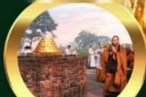
เขตวันมหาวิหาร เมืองสาวัตถี