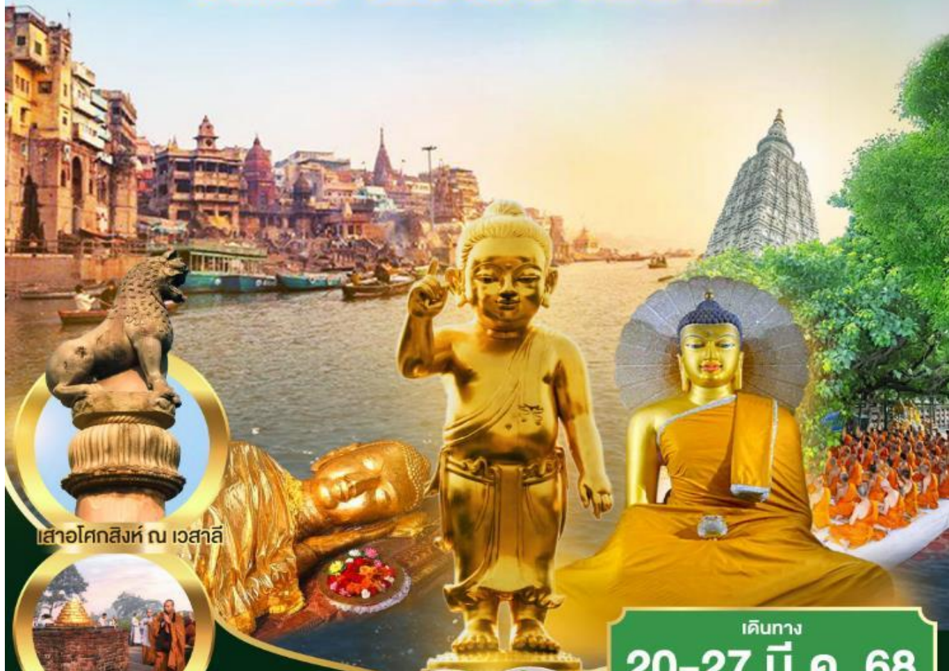
เสาอโศกสิงห์ ณ เวสาลี