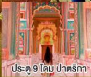
ประตู 9 โคม ปาตริกา