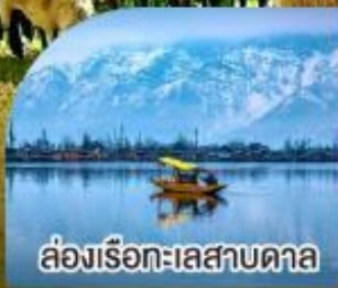
ล่องเรือทะเลสาบคาล