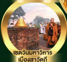
เขตวันมหาวิหาร เมืองสาวัตถี