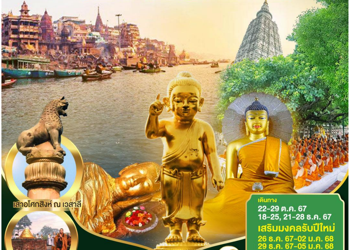
เสาอโศกสิงห์ ณ เวสาลี