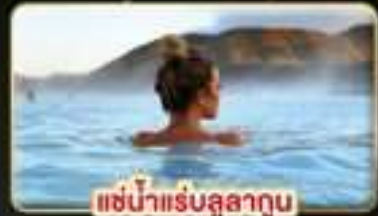
แช่น้ำแร่สุขภาพ