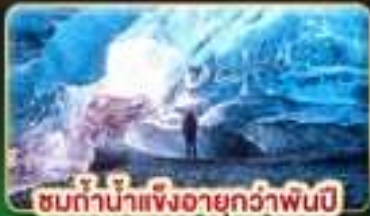
ชมถ้ำน้ำแข็งอายุกว่าพันปี