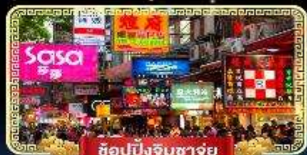
ช้อปปิ้งจิมซาจู้