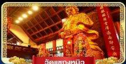
วัดเข่งหมิว