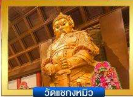
วัดเซกทมิว

📍 อิสระ-ช้อปปิ้งย่านจิมซาจู้ & คอสเวย์เบย์