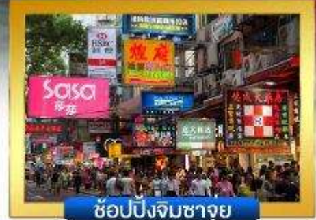
ช้อปปิ้งจิมซาจู้