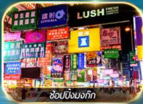
ช้อปปิ้งมงก๊ก

เต็มอิ่มทั้งบุญ และ ช้อปปิ้งแบบจัดเต็ม จิมซาจุ่ย มงก๊ก