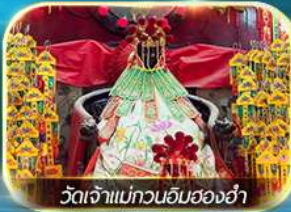
วัดเจ้าแม่ทวนอิมของฮ่า