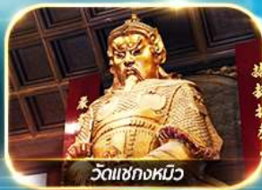
วัดแชกงหมิว