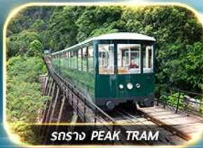
รถราง PEAK TRAM