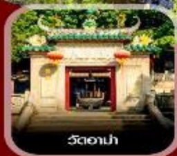
วัดอานาม