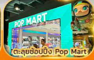
ตะลุยช้อปปิ้ง Ping Pop Mart