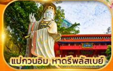
แม่กวนอิม หาดรีพลัสเบย์