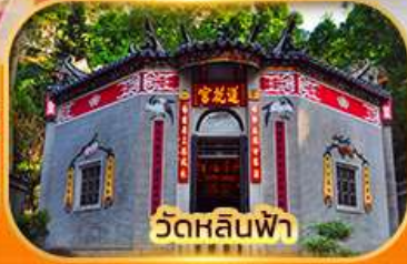
วัดหลินฟา