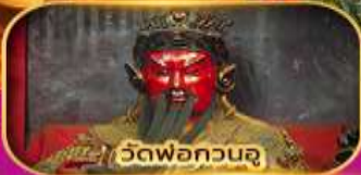
วัดพ่อกวนจู