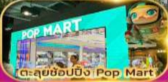
ตะลุยช้อปปิ้ง Pop Mart