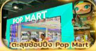
ตะลุยช้อปปิ้ง Pop Mart