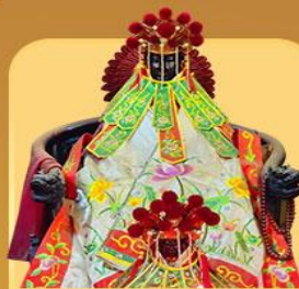
เจ้าแม่กวนอิมสองขำ