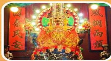
วัดเจ้าแม่กวนอิมเทียนหัว