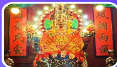
วัดเจ้าแม่กวนอิมเทียนหัว