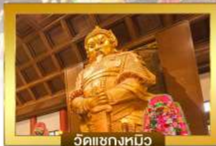
วัดแซงหมิว